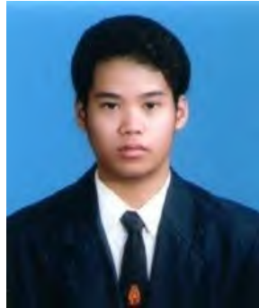
นักศึกษาชาย