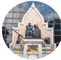
พระบรมราชานุสาวรีย์ รัชกาลที่ 4

พระบรมราชานุสาวรีย์ พระบาทสมเด็จพระปรเมนทรมหามงกุฎฯ พระจอมเกล้าเจ้าอยู่หัว รัชกาลที่ 4 ประดิษฐานอยู่ด้านหน้าทางเข้ามหาวิทยาลัยเทคโนโลยีพระจอมเกล้าพระนครเหนือ กรุงเทพมหานคร