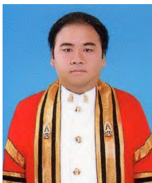
นักศึกษาชาย