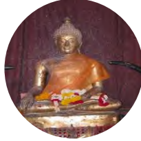
หลวงปู่สิงห์