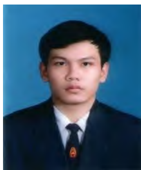
นักศึกษาชาย