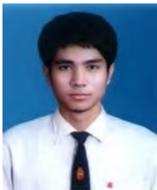
นักศึกษาชาย