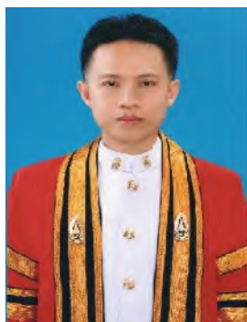
นักศึกษาชาย