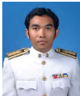
นักศึกษาชาย